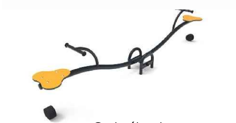
C - huśtawka wagowa