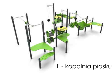
F - kopalnia piasku