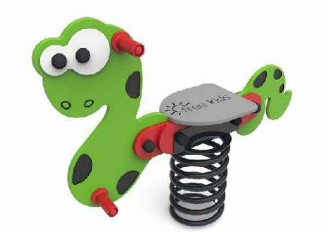
D/E - bujaki na sprężynie