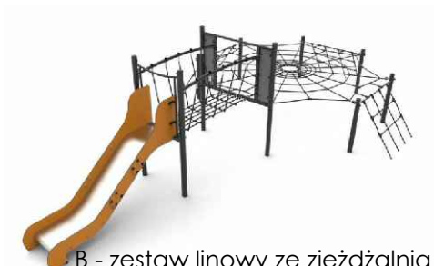
B - zestaw linowy ze zjeżdżalnią