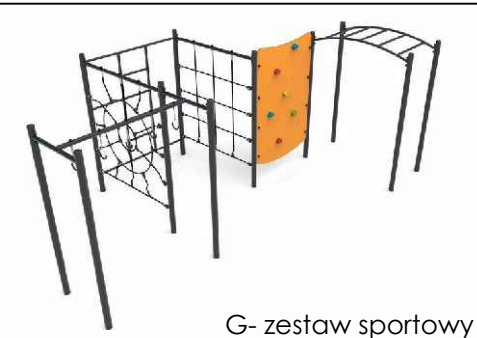
G - zestaw sportowy

FIRMA WIELOBRANŻOWA 62-001 Gołębiewo, ul. Żurawia 20C REG. 630782581 NIP 777-17-93-016 tel. (41) 8-116-056